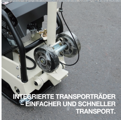
INTEGRIERTE TRANSPORTRÄDER – EINFACHER UND SCHNELLER TRANSPORT.