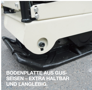
BODENPLATTE AUS GUSSEISEN – EXTRA HALTBAR UND LANGLEBIG.