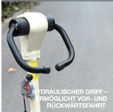
HYDRAULISCHER GRIFF – ERMÖGLICHT VOR- UND RÜCKWÄRTSFAHRT.